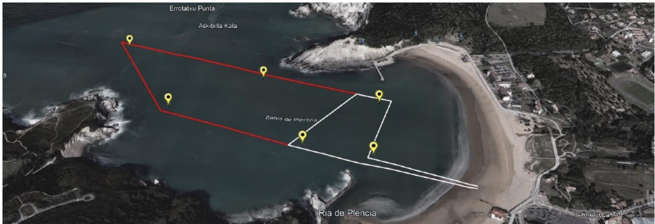
Ilustración 1 Croquis recorridos 1.500 metros (blanco) y 3.000 metros (rojo)

En la distancia larga, el recorrido partirá desde la playa de Gorliz hasta la primera boya de giro que estará altura de la playa Muriola de Barrika y luego, hasta la segunda que estará mar adentro. Una vez dada la vuelta en esta boya se irá hasta la tercera y última, que estará a la altura del Muelle de Astondo. Desde este punto se regresa a la zona de la playa donde estará situada la recta meta.